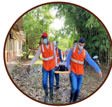
Simulacro de Emergencia