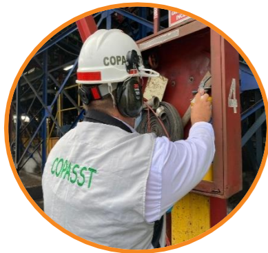
Inspecciones en Planta

Desde el área de S.S.T continuamos con nuestra labor y propósito de ayudar a mantener un ambiente tranquilo, seguro y de calidad para los colaboradores.