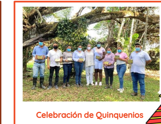
Celebración de Quinquenios