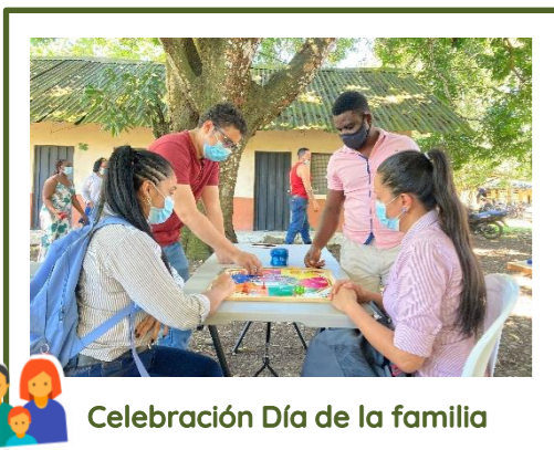
Celebración Día de la familia