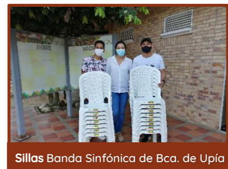
Sillas Banda Sinfónica de Bca. de Upía