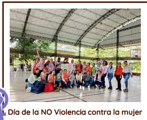
Día de la NO Violencia contra la mujer