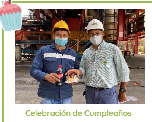
Celebración de Cumpleaños