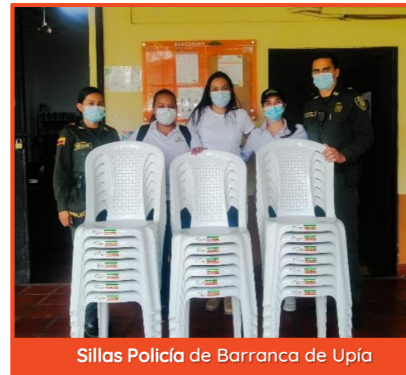
Sillas Policía de Barranca de Upía