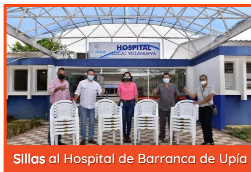
Sillas al Hospital de Barranca de Upía