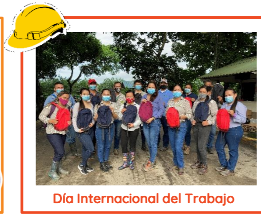
Día Internacional del Trabajo