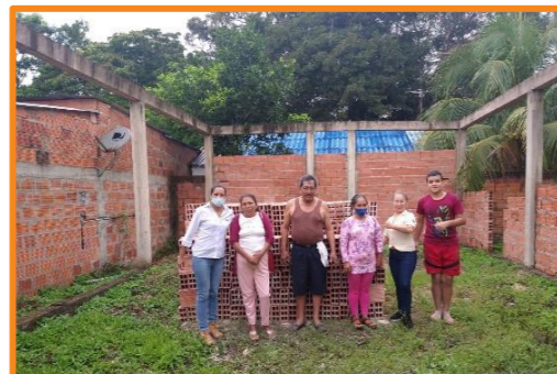
Ladrillos Vereda el Hijo

Apoyarnos los unos a los otros siempre será el mayor acto de bondad y generosidad. ¡Donar es amar!