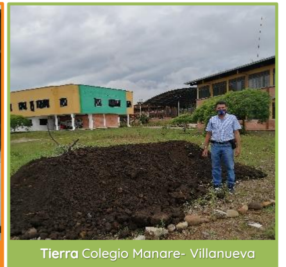
Tierra Colegio Manare- Villanueva