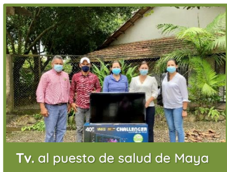
Tv. al puesto de salud de Maya