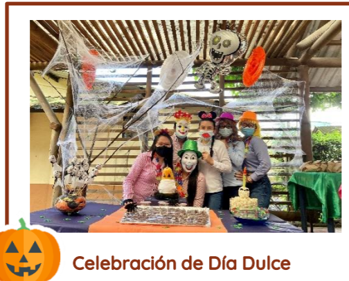
Celebración de Día Dulce