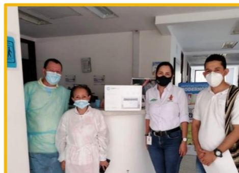
Impresora al Hospital de Barranca de Upía