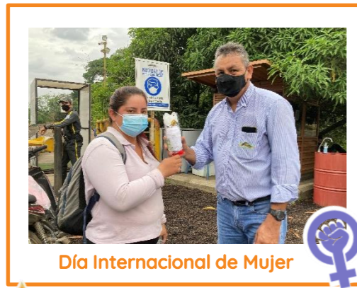
Día Internacional de Mujer

En el 2021 retomamos poco a poco las actividades de Bienestar Social en la que nuestros colaboradores se integraron y compartieron espacios de sana convivencia, llenos de risas y entretenimiento.