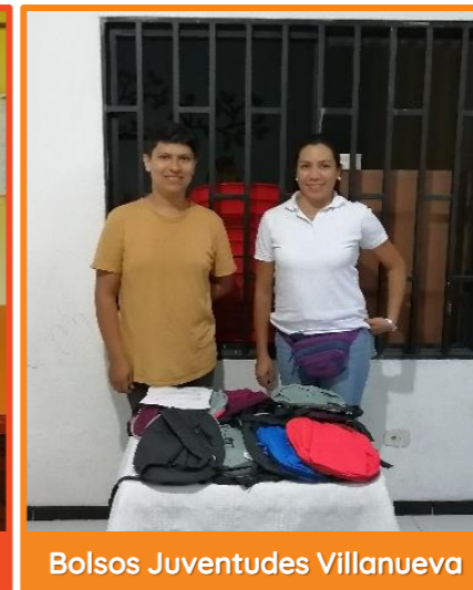
Bolsos Juventudes Villanueva