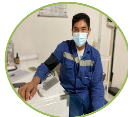
Jornada de Tamizaje Cardiovascular