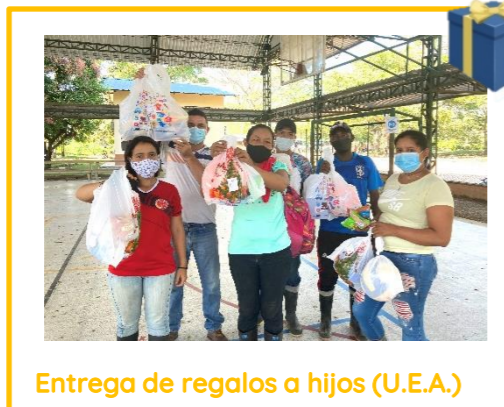
Entrega de regalos a hijos (U.E.A.)