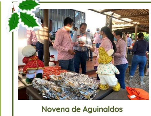
Novena de Aguinaldos