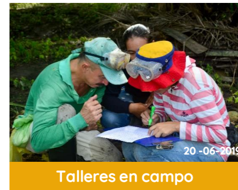
Talleres en campo

Impulsamos el desarrollo de actividades que promuevan la creatividad y la sana convivencia, con lo cual fortalecemos nuestro equipo de trabajo y consecuentemente, impactamos de forma positiva la productividad.