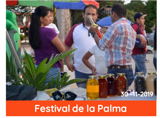
Festival de la Palma