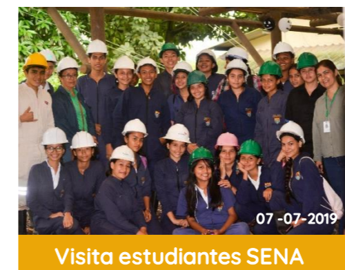
Visita estudiantes SENA