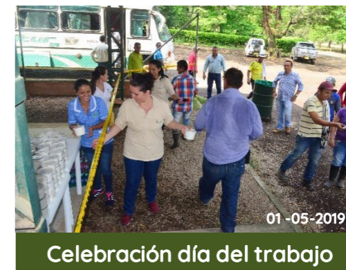
Celebración día del trabajo