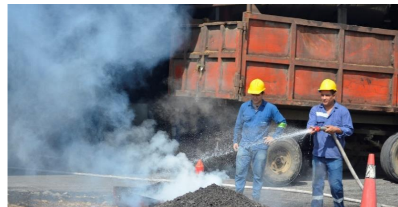
Realizamos simulacros contra incendios