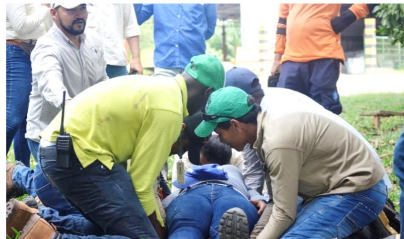
Capacitamos en primeros auxilios