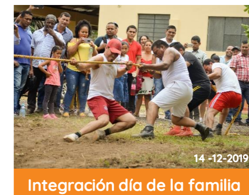
Integración día de la familia