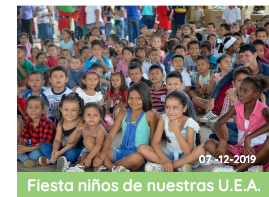
Fiesta niños de nuestras U.E.A.