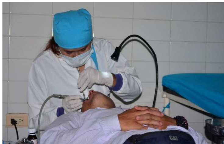
Brindamos brigadas de Salud