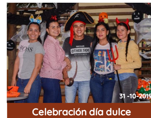
Celebración día dulce