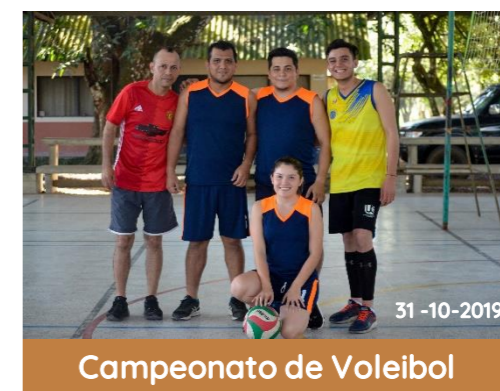
Campeonato de Voleibol