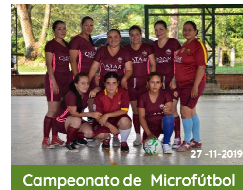
Campeonato de Microfútbol