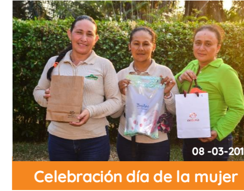
Celebración día de la mujer