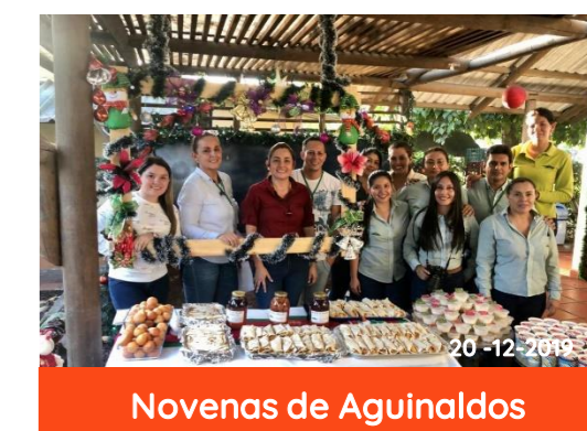
Novenas de Aguinaldos