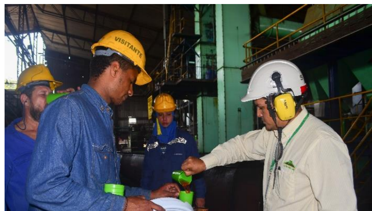
Hidratamos a nuestro personal